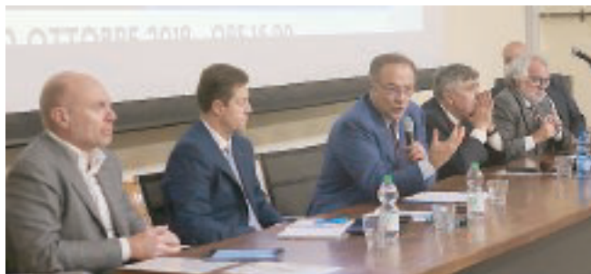
SCIENZE ECONOMICHE Un momento dell'incontro.

laddove la stessa si evolve, condividendo priorità e programmi per raggiungere gli obiettivi» ha evidenziato Alessandro Chiesi, presidente di «Parma, io ci sto!», durante un convegno organizzato dal Dipartimento di Scienze economiche ed aziendali dell'Università di Parma. Alla tavola rotonda, aperta dalle riflessioni del rettore dell'Università di Parma, Paolo Andrei, e di Luca Di Nella, direttore del Dipartimento di Scienze economiche ed azien-