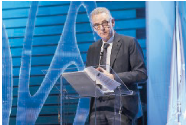
ASSEMBLEA ANCE L'intervento del presidente Gabriele Buia.

stante gli sforzi fatti alcune delle riforme, che come Ance abbiamo proposto e contribuito a far approvare, rimangono ancora tutte da attuare o completare», sottolinea il presidente, denunciando quindi che la lista delle opere bloccate «è ancora lunga» per un totale di 749 per 62 miliardi di euro. «Nell'elenco c'è di tutto: scuole, ospedali, strade e anche fondamentali opere di messa in sicurezza come quelle che riguardano il letto del fiume Sarno, noto per la tragica frana di oltre 20 anni fa che causò 160 morti», afferma Buia, precisando che si tratta di «220 milioni non utilizzati per un'opera che può